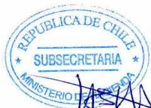
Visación Subsecretaría de Hacienda